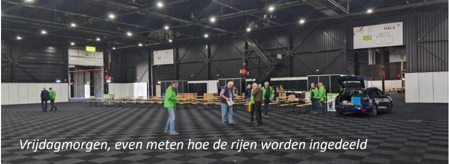
Vrijdagmorgen, even meten hoe de rijen worden ingedeeld

Half september tweeduizendvijftwintig hebben wij weer onze halfjaarlijkse vogelmarkt gehouden in Hardenberg. Vrijdagmorgen zijn we met vier personen op weg gegaan om te helpen met de opbouw van de vogelmarkt.