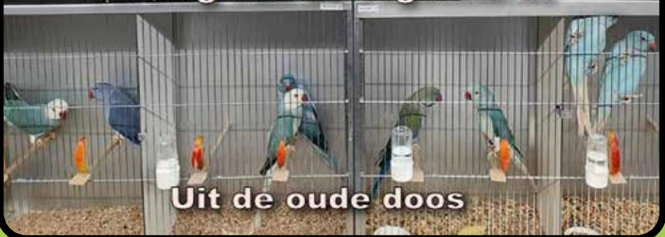
Uit de oude doos