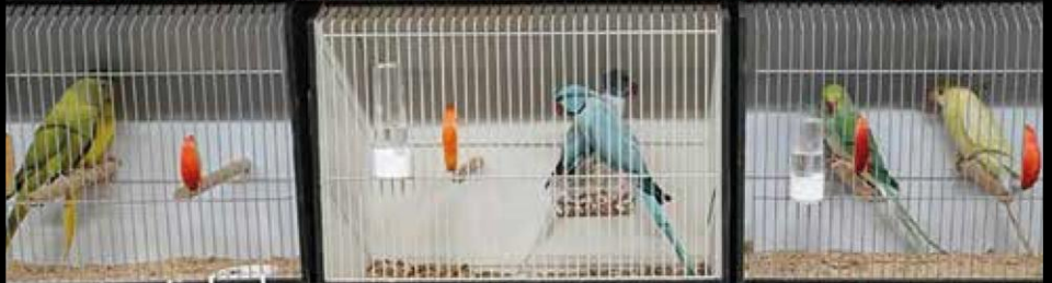
Verslag van de vogelmarkt