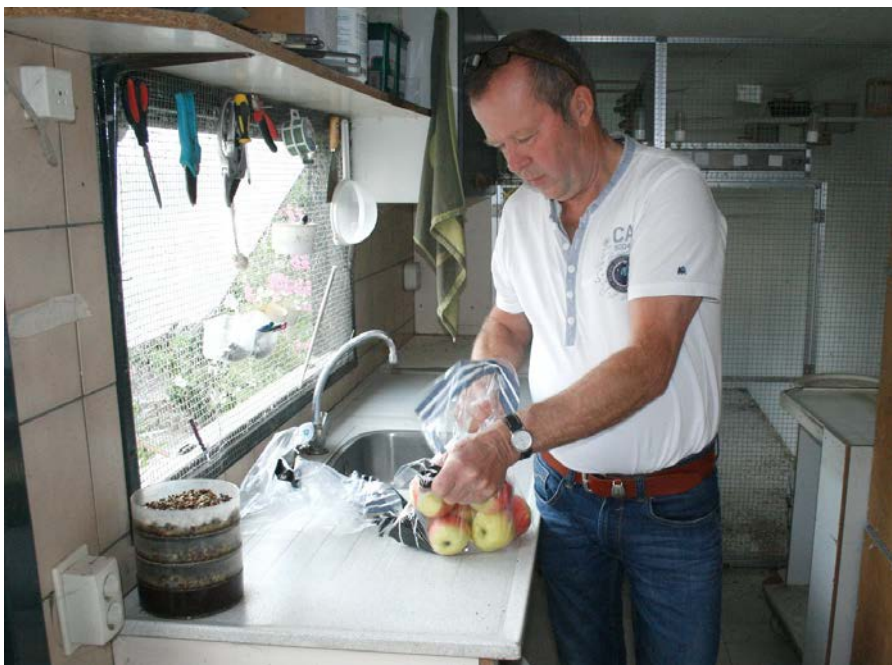
Voer gereed maken onder toezicht van zijn Pyrthurra's